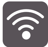
TELECOMUNICACIONES Y REDES